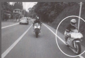
↑右端に写ってるライダーさん！心当たりある人は左記のお店に連絡すると写真が贈呈されます！