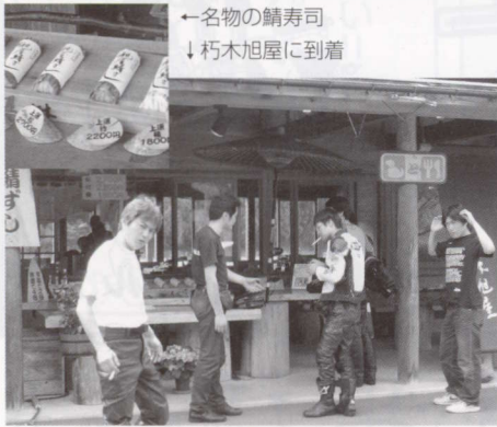
←名物の鯖寿司 ↓朽木旭屋に到着