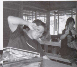
↑朽木旭屋店内で！手前にある銀色の所で貼を焼いてくれました。