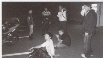
←能勢付近のコンビニで休憩中。