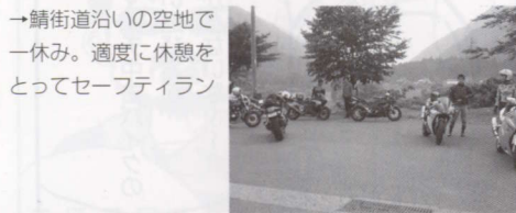
→鯖街道沿いの空地で一休み。適度に休憩をとってセーフティラン