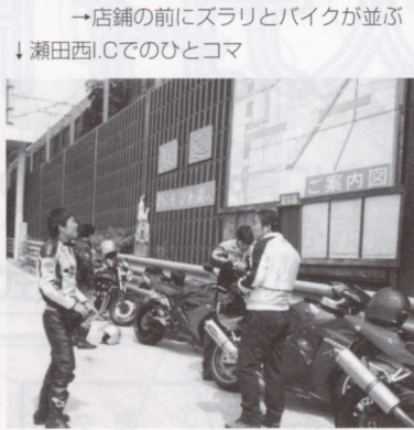
→店舗の前にズラリとバイクが並ぶ ↓瀬田西.I.Cでのひとコマ